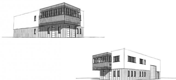
L'immeuble des Enrobés Namurois

À Assesse, un projet d'usine à tarmac inquiète certains riverains. Ses promoteurs assurent pourtant qu'il s'agira de l'unité de production « la plus écolo de Belgique ». Ils ont profité d'une réunion publique, organisée ce mercredi 11 mars, pour présenter plus en détail leur dossier.