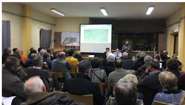
La réunion se tenait à Sart-Bernard.

Représenté à la réunion de ce mercredi, le Comité Villageois de Sart-Bernard a fait savoir, sur sa page Facebook, son opposition au projet présenté par les sociétés Nonet et Sotraplant. Le comité met avant les arguments suivants :