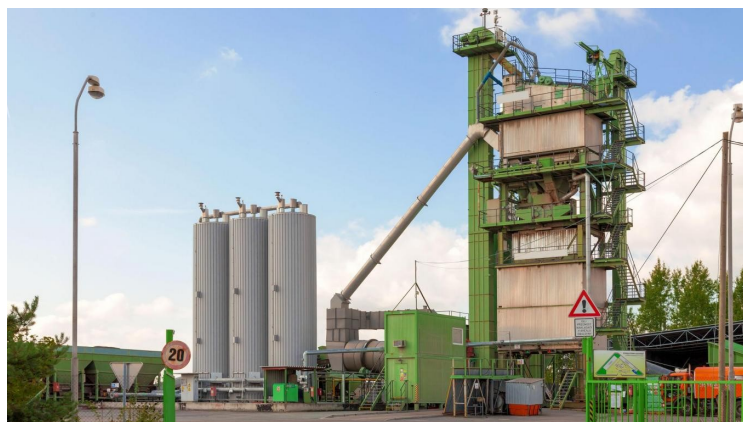
Une centrale d'enrobage.

Une réunion publique a permis d'en savoir plus sur le projet de « centrale d'enrobés » qui pourrait voir le jour à Assesse, entre la N4 et la E411. Ses promoteurs assurent que cela créera des dizaines d'emplois et que l'impact environnemental est pris au maximum en considération.